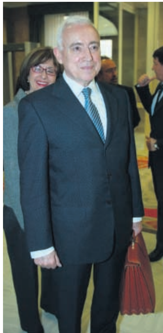
El presidente de la AEB, en el Congreso de los Diputados

En definitiva, con independencia de la consideración que nos merezca la respuesta dada por la legislación vigente, si el banco, una vez subastado el inmueble hipotecado, no ha conseguido cobrar la totali-